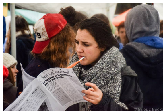
Ici la Cambre, oui. Mais sans oublier l'hygiène dentaire!