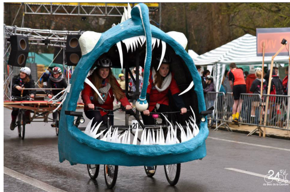
Le poisson de némo: Folklo Gagnant de la 29ème édition

J'ai regardé dans le fond d'une tasse de thé et il y avait une sorte de chat, ça veut dire que tu vas cartonner très prochainement. Ça ou une acné virulente je sais plus trop.