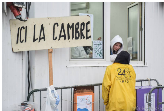
Le stand Ici la Cambre au QG, n'hésitez pas à venir nous faire un petit coucou!